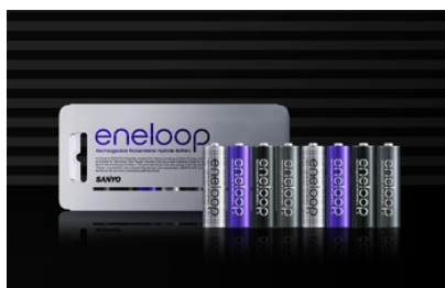
エネルーブ トーンズ ウォモ