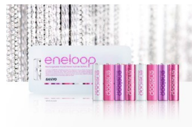
エネルーブ トーンズ ルージュ